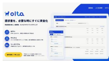
登録方法紹介動画