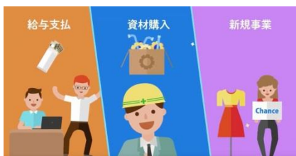
サービス紹介動画

エフティグループとOLTAは、「クラウドファクタリング」のサービス連携を通して、お客様に信頼されるパートナーとなることを目指すとともに、デジタルによるビジネスの変革とイノベーション創出を加速させていきたいと考えています。